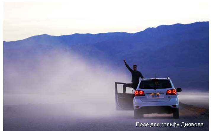
Поле для гольфу Диявола