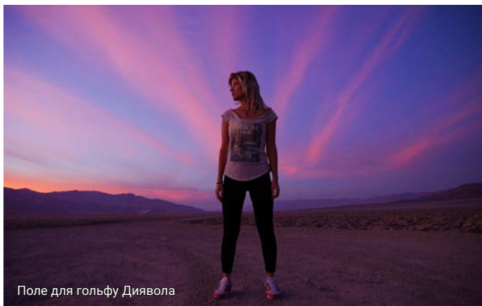
Поле для гольфу Диявола

Взявши приклад з місцевих мешканців, ми запакувалися у перший же мотель і полягали спати.